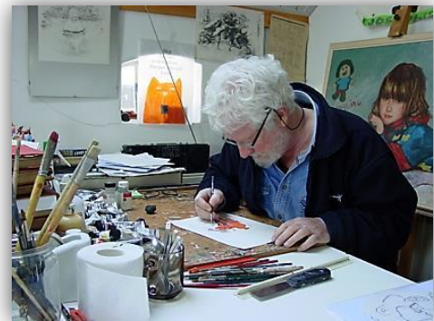
Jan Kruis bedacht 'Jan, Jans en de kinderen'

De meeste kinderen kunnen tekenen. Een aantal daarvan kan dat misschien heel goed. Uiteindelijk doen veel kinderen dat niet meer als ze wat ouder zijn. Houd je veel van tekenen, en wil je daar graag je beroep van maken? Vraag je ouders of een leerkracht om raad. Misschien ken je wel iemand die voor zijn beroep tekent of schildert. Die kan jou daarover vast wel advies geven.