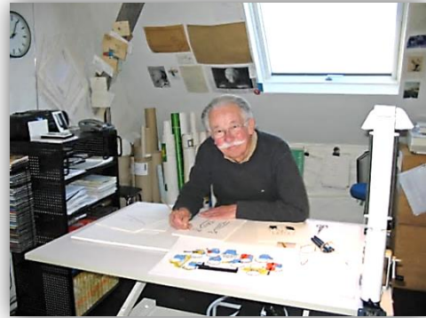
Dick Bruna bedacht 'Nijntje'

Daar kom je achter als je ermee door wilt gaan, en naar een kunstacademie wilt. Je moet daar precies vertellen waarom je verder wilt gaan met tekenen. Daar kun je nu al over nadenken. Als je een boek schrijft, moet je wat te vertellen hebben. Dat is ook zo als je iets tekent of schildert.