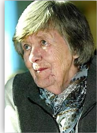
Fiep Westendorp tekende 'Jip en Janneke'

Dan wil je misschien wel illustrator worden. Je kunt als illustrator voor boeken, kleding, televisie of bijvoorbeeld reclame illustreren. Een illustrator moet zich goed kunnen inleven in het werk, waarvoor hij of zij illustraties maakt. Wat je als idee in je hoofd hebt, moet je dus goed op papier kunnen laten zien. Verder heb je een eigen tekenstijl ontwikkeld.