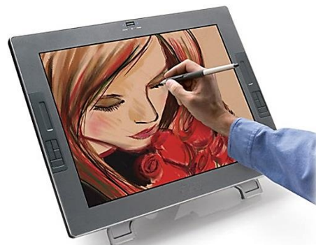
Digitaal illustreren op een tekentablet